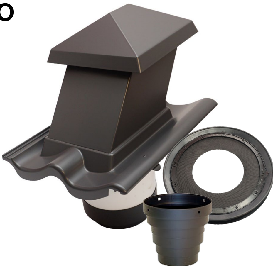
Tryktab HV15x15 med rundt ISO-rør (Luft ud)

Skal pakkes ud af plastposen ved placering i sollys.